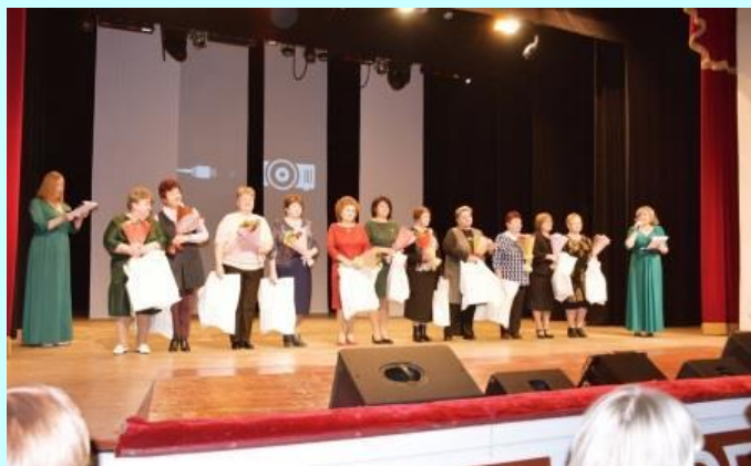
Ветераны педагогического труда