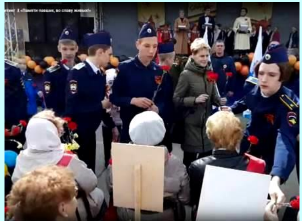
Коллективный рисунок «Памяти героев, во славу жизни»