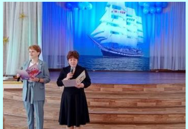
Выпускники 9а класса.