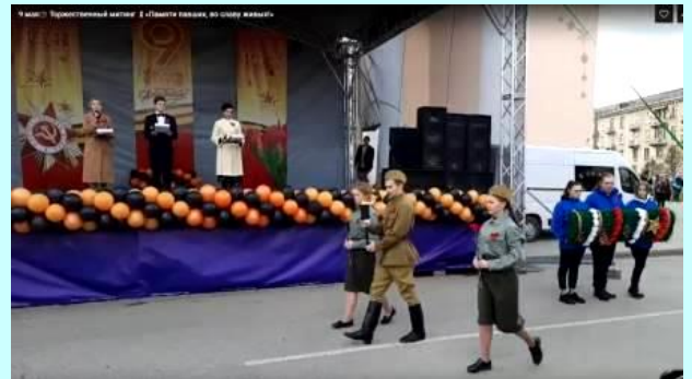
Коллективный рисунок «Памяти героев, во славу жизни»