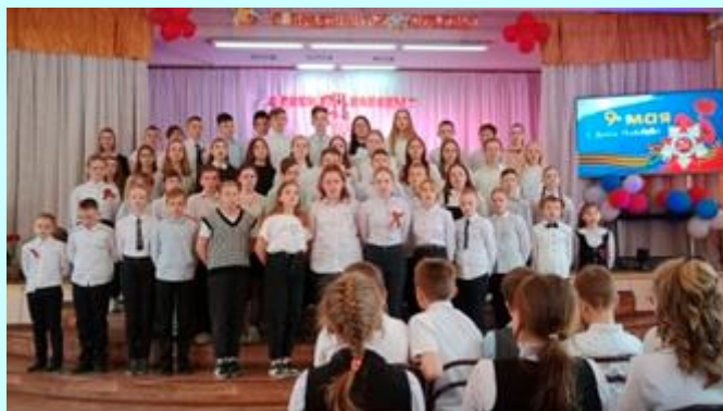
5б и 7б классы