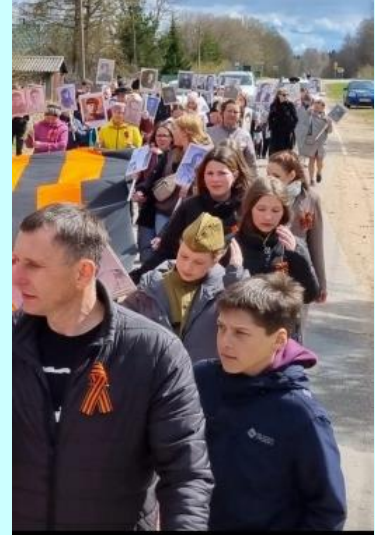
Бессмертный полк опять в строю Участствует в торжественном параде Портреты победителей несут Бессмертие представлено к награде.