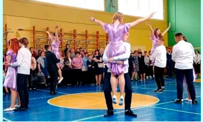
Выпускники 9б класса.