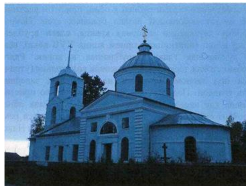
Церковь Тихвинской иконы Божьей Матери

В годы советской власти церковь Тихвинской иконы Божьей Матери была закрыта и использовалась под различные хозяйственные нужды. В настоящее время усилиями петербургских реставраторов церкви вернули первоначальный нил.