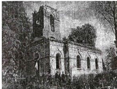
Церковь св. вмч. Георгия Победоносца. Фото начала XXI века.

А Георгиевская церковь восстанавливается, в ней проводятся службы.