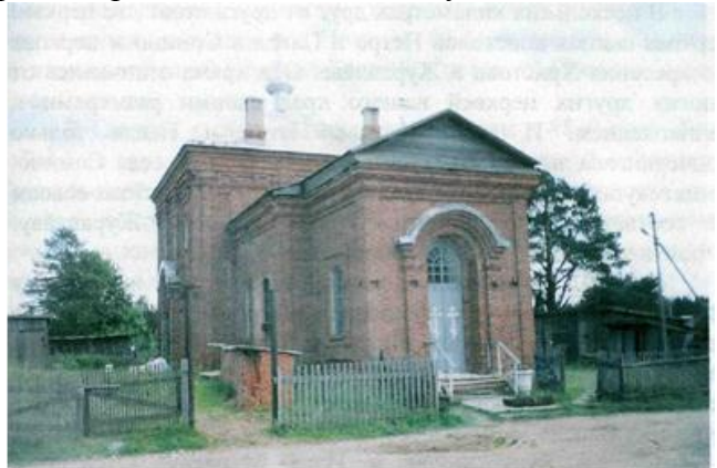
Церковь пророка Илии. Снимок 2010 года. Соминский и Суглицкий погосты.

Основой для реставрации церкви послужил снимок, запечатлевший её закрытие. В настоящее время церковь является действующей.