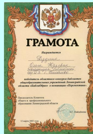
Выступление в номинации «Перспектива», работа по теме «Игра, как средство информации»

Участники второго тура конкурса распределились по номинациям следующим образом: