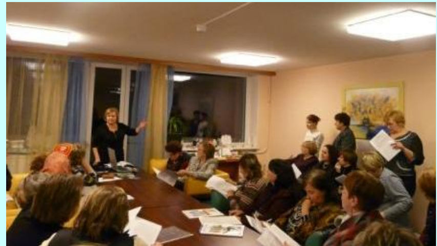
Подведение итогов работы Съезда.