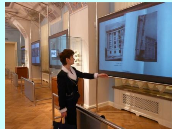
Экскурсия по библиотеке им. Б.И. Ельцина