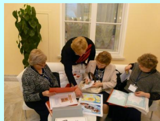
Деление опытом своей работы.