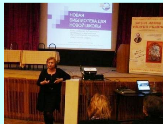
Выступление директора и зав. библиотеки школы по теме «Развитие школы – через развитие библиотеки»