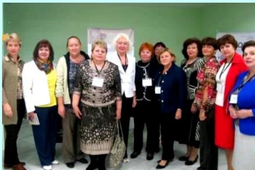
Делегация из Ленинградской области с президентом РШБА Жуковой Т.Д.