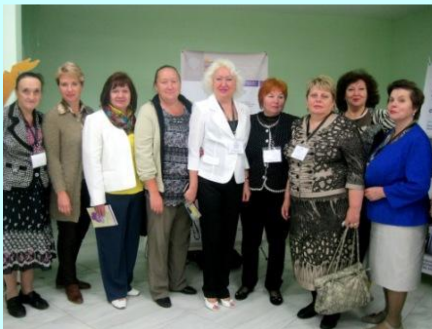
Делегация из Ленинградской области