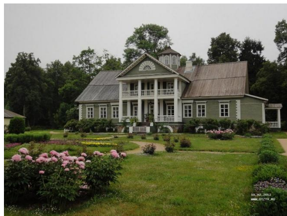
Родовое имение Ганнибалов.