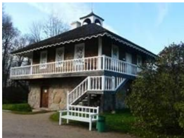
Дом-музей А.П. Ганнибала