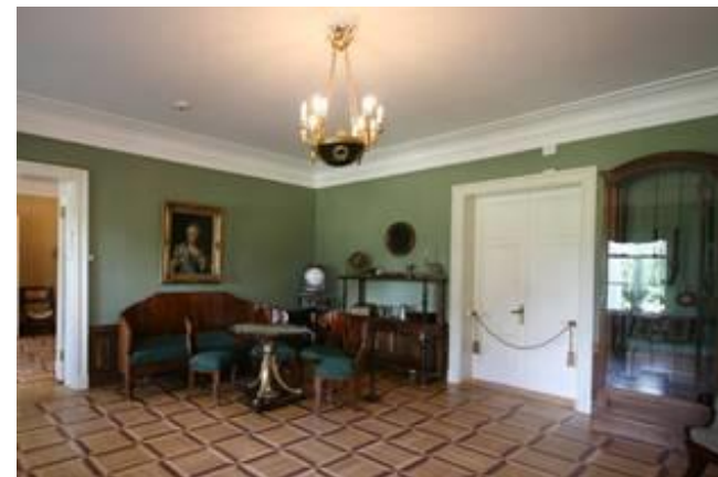
Кабинет П.А. Ганнибала