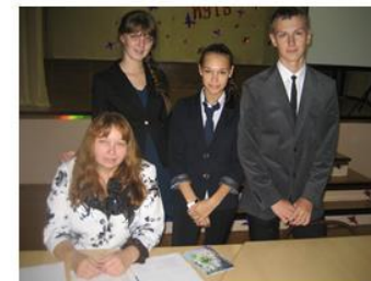
Совет музея охраны природы