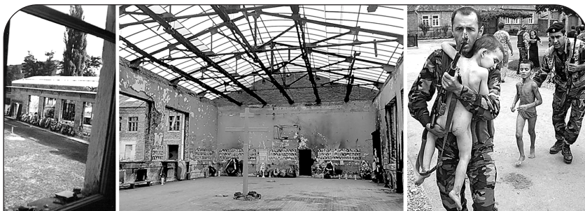
Из этого окна пулемет террористов поливал свинцом детей, разбежавшихся после взрыва в спортзале.

Но именно это и нужно было террористам: чем больше ужаса, тем легче добиться своего. Они знали, что за стенами школы мечутся обезумевшие от горя родственники заложников. Они видели из окон, что отцы захваченных детей рвутся к оружию. Все это воздействовало на власти, заставляло их лихорадочно искать выход из ситуации. Ведь власти понимали, что они не должны принимать условия террористов. Но еще лучше они понимали, что не имеют права допустить гибели заложников!